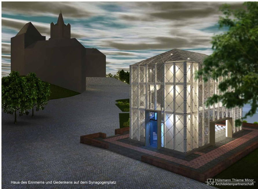
Abb. 4: Architekturstudie für das Haus des Erinnerns und Gedenkens auf dem Synagogenplatz.

zung notwendigen Gelder einzuwerben. 37 Als weithin sichtbare „Lichtikone“ am Ort der schwärzesten Stunde der Stadtgeschichte beschreibt Architekt Friedhelm Hülsmann das transluzente dreigeschossige Bauwerk mit einem offenen Gedenkraum im Erdgeschoss.