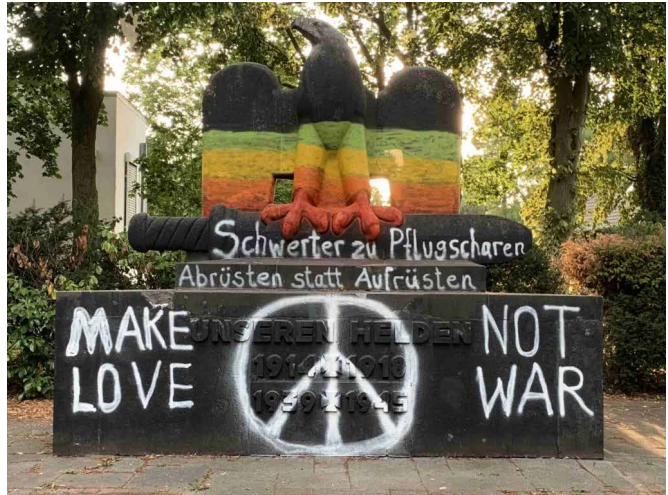
Abb. 3: Das Kalkarer Kriegerdenkmal nach der Aktion des Künstlers Wilfried Porwol.

reszahlen 1939–1945 unter der Widmung „Unseren Helden“ erst im Frühjahr 1983 ergänzt worden waren.