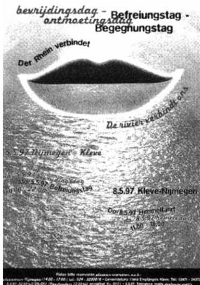
Abb. 2: Plakat zum Befreiungstag-Begegnungstag in Nijmegen und Kleve 1997.

1996 gab es den ersten grenzüberschreitenden Programmbeitrag zu den 5. Mai-Feiern in Nijmegen, mit Fortsetzung in Kleve, wo der 8. Mai erstmals überhaupt begangen wurde. Am 5. Mai 1997 fuhr man mit einem alten Rheindampfer von Nijmegen Richtung Landesgrenze. Unter dem Motto „Der Rhein verbindet – Befreiungstag – Begegnungstag“ präsentierte ein deutsch-niederländisches Trio Lieder von Brecht/Eisler und Hildegard Knef. Hedda Kalshoven-Brester las aus dem