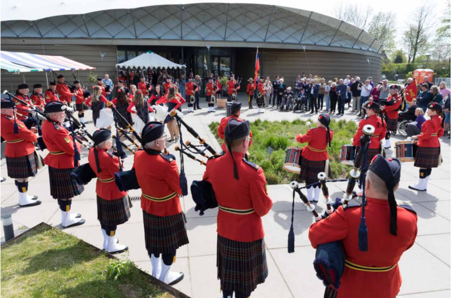
Abb. 1: Alliierte Veteranen besuchen das Freiheitsmuseum Groesbeek.