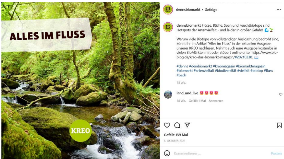
Abb. 9: Gefährdete Biotöpe, https://www.instagram.com/p/CUxS2Skq35L/ (22.03.2022)

gesetzt wurde, setzt der folgende Post vor allem auf Information über ökologische Probleme der Gegenwart, ohne dass auf den ersten Blick überhaupt geworben wird (s. dazu auch Abbildung 2).