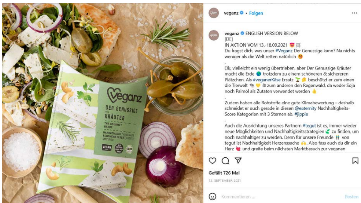
Abb. 8: Käseersatz von Veganz, https://www.instagram.com/p/CTudiAJMx4q/ (22.03.2022)

In den folgenden Posts geht es narrativ vorrangig darum, die Notwendigkeit nachhaltiger Veränderungen in Form von Brüchen mit traditionellen Verhaltensweisen zu fokussieren.