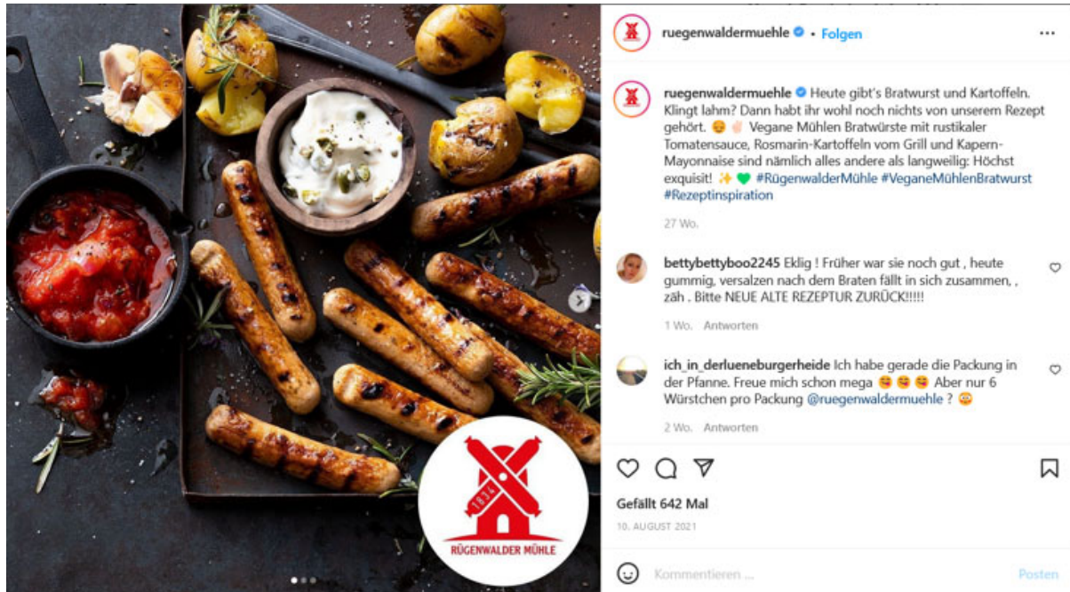
Abb. 5a: Vegane Bratwurst, https://www.instagram.com/p/CSZktO4qYAF/ (20.03.2022)

Auch die beiden folgenden Posts arbeiten auf für das analysierte Korpus typische Weise bildlich und sprachlich mit der Annahme, dass es sich um unverpackte Produkte (Highlighting) handelt und verdecken hierbei (Hiding), dass die abgebildeten Produkte in Gänze bzw. in ihren Teilelementen verpackt gekauft werden müssen: