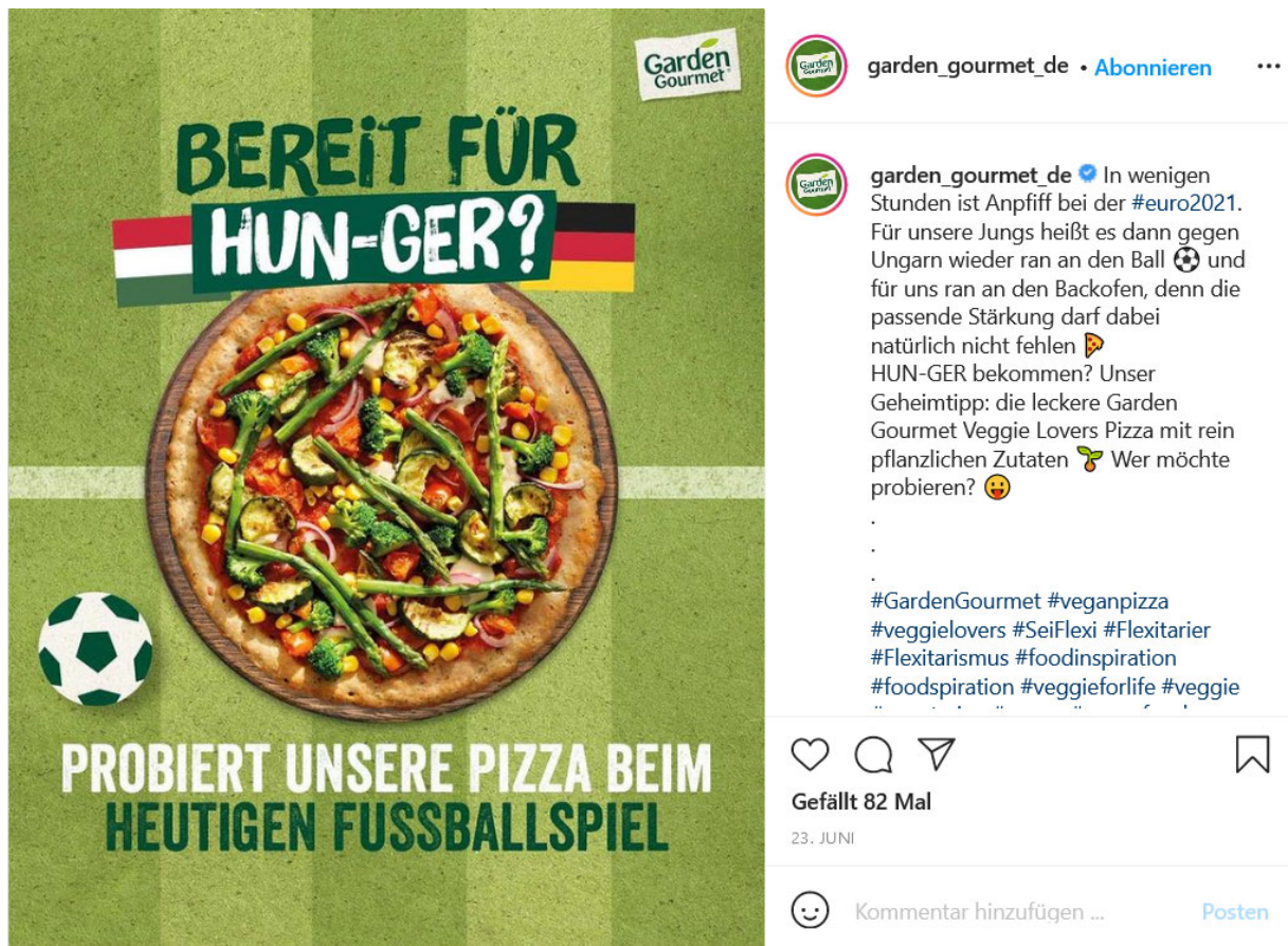
Abb. 3: Post vom 23.06.2021 vom Instagram-Account von Garden Gourmet, https://www.instagram.com/p/CQcmLS8KqZ3/ (13.02.2022)