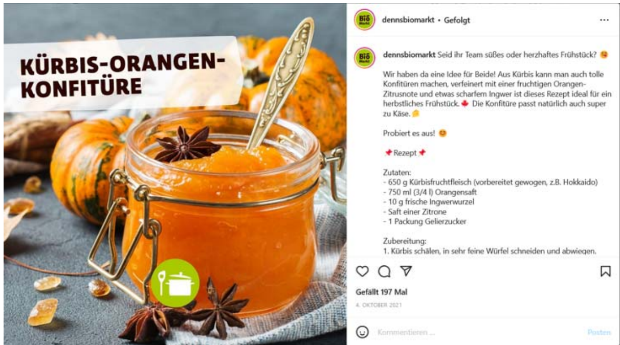
Abb. 5b: Kürbis-Orangen-Konfitüre, https://www.instagram.com/p/CUm_nBDKHdf/ (20.03.2022)

In beiden Posts wird durch die Abbildung der fertigen und angerichteten Mahlzeiten der Eindruck erweckt, die dargestellten Lebensmittel seien das Ergebnis nachhaltiger Prozesse der ausschließlich selbst durchgeführten Verarbeitung vollwertiger Lebensmittel. 'Verdeckt', d.h. nicht gezeigt, werden hierbei vielfältige Aspekte, die vom Ort des Anbaus der genutzten Lebensmittel (frische Ananas, Orangen, Paprika) über deren Lieferketten auf den Tisch der Verbraucher*innen (Kürbis, Ananas, Orangensaft, Paprika) bis hin zu den Verpackungen (Würstchen, Orangensaft, Dosenananas, Dips) reichen.