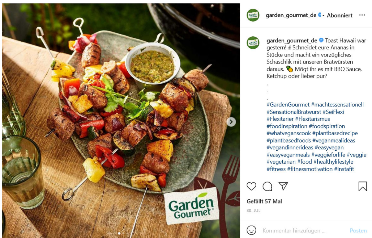
Abb. 6: Vegane Schaschlik-Spieße von Garden Gourmet, https://www.instagram.com/p/CR8g4tHqaQu/ (20.03.2022)

An vielen Stellen des untersuchten Korpus lässt sich die Tendenz erkennen, den Eindruck der Kontinuität veganer Ernährung mit bereits traditionell vertrauten Gewohnheiten fortsetzen zu können. Dies zeigt sich vor allem dort, wo traditionelle Fleisch- oder Fischprodukte unter Nutzung narrativer Elemente vegan neu wahrgenommen werden sollen, wie sich an dem in Abbildung 6 gezeigten Post von Garden Gourmet zu veganen Schaschlik-Spießen verdeutlichen lässt: