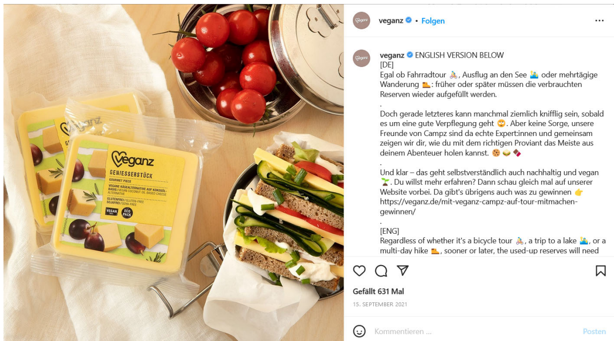
Abb. 4: Veganer Käseersatz, https://www.instagram.com/p/CT2ciGnM5S9/ (20.03.2022)

Während bei der vorherigen Analyse nur das Bild und die sprachlichen Bestandteile des Feeds betrachtet wurden, sollen im Weiteren auch die sprachlichen Elemente der Caption berücksichtigt werden. Hierbei ist relevant, dass die Caption von Rezipient*innen in der Regel erst dann erlesen wird, wenn das Bildelement Interesse erzeugt hat.