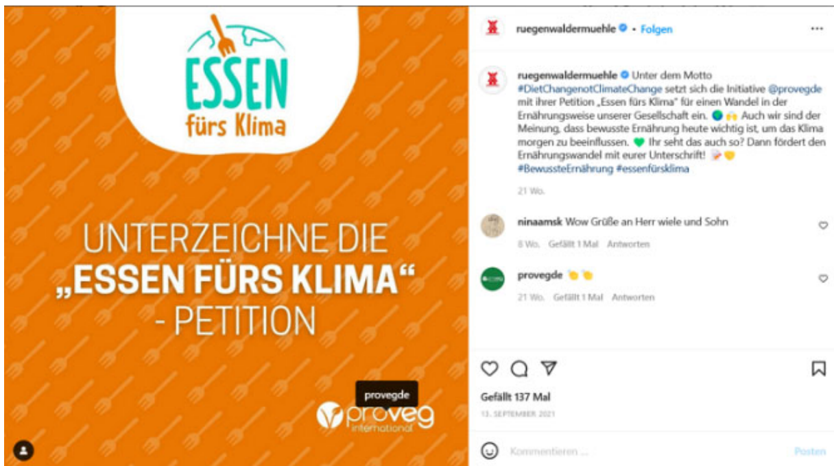
Abb. 2: Politik oder Werbung, https://www.instagram.com/p/CTxFvsUovLp/ (26.03.2022)

Für das im Folgenden analysierte Korpus, in dessen Rahmen Fragen der Nachhaltigkeit kommunikativ kontinuierlich aktualisiert werden, ist entscheidend, dass keineswegs durchgängig oberflächlich werbende Verfahren genutzt werden, wie der folgende Post von Rügenwalder Mühle paradigmatisch verdeutlicht: