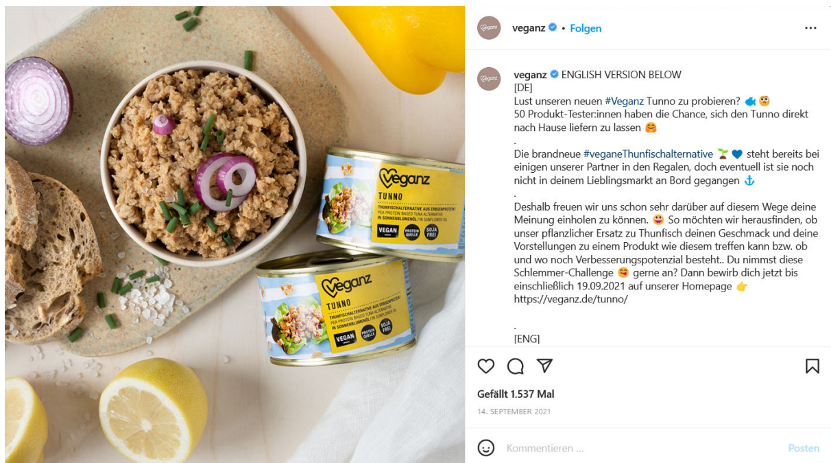
Abb. 7: Tunfischersatz von Veganz, https://www.instagram.com/p/CTzxbC7jOMd/ (22.03.2022)

Das analysierte Narrativ bestätigt (mit kleinen Abweichungen) auch der folgende Post in Abbildung 7. Der vegane Thunfischersatz von Veganz in Abbildung 8 setzt traditionelle Kaufgewohnheiten von Thunfisch in der vertrauten Konservendose für die Zukunft fort. Denn obwohl das Produkt noch nicht bei allen Anbieter*innen „an Bord gegangen“ ist (s. Caption), ist es über die Zufriedenheitsbefragung der Nutzer*innen auf Zukunft ausgerichtet und damit in der Lage, die Differenz zwischen ‘Fisch’ und ‘veganem Ersatz’ zu nivellieren.