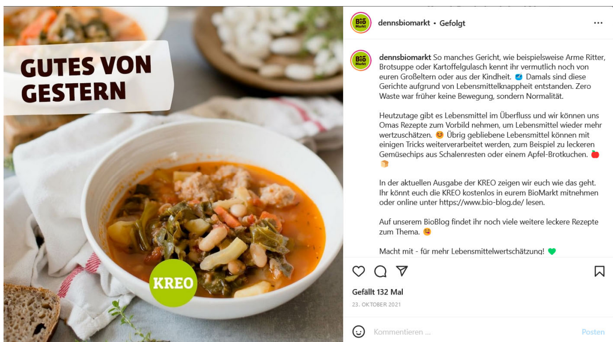
Abb. 10: Gutes von gestern, https://www.instagram.com/p/CVXmG_nqhEt/ (22.02.2022)

Diese Art der werbenden Konstruktion der individuellen Möglichkeit der Weltrettung durch ein spezifisches Ernährungsverhalten findet sich aber auch in einer Vielzahl weiterer Posts, die das Narrativ der Weltrettung mit anderen (teils bereits erwähnten) Narrativen verknüpft. So wird im folgenden Post, der ebenfalls auf die Werbezeitschrift Kreo Bezug nimmt, eine Kombination aus dem Narrativ der Weltrettung, dem Narrativ des Traditionellen und dem analysierten metonymischen Komplex SELBST MACHEN IST NACHHALTIGKEIT vorgenommen, die hier zu einem Narrativ ausgebaut wird.