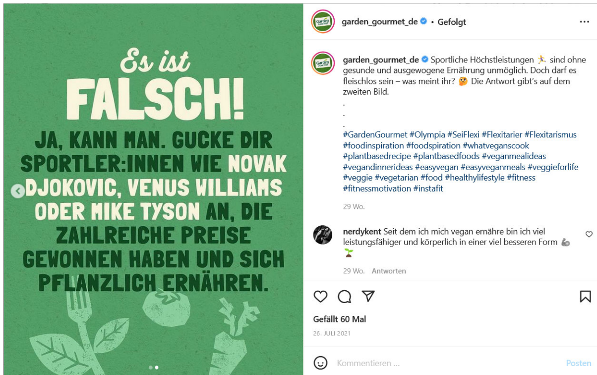
Abb. 12: Vegane Ernährung und Profisport, https://www.instagram.com/p/CRysjTBqq-E/ (31.10.2021; nicht mehr online)

Auf eine ähnliche Mischung aus informativen und argumentativen Aspekten setzt auch das Narrativ der „körperlichen Leistungsfähigkeit trotz veganer Ernährung“, das der folgende Post nutzt: