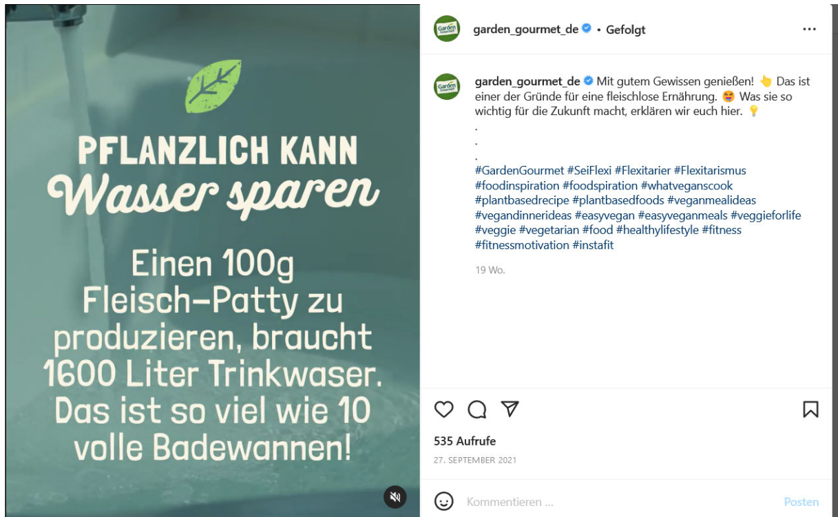
Abb. 11: Wasserverbrauch und die Herstellung von Fleischprodukten, https://www.instagram.com/p/CUU3P8FKs90/ (01.04.2022)