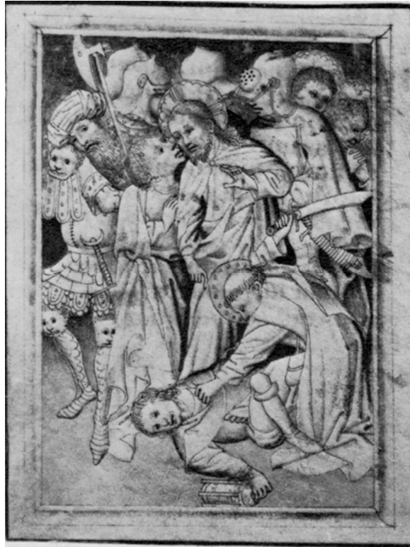
Abb. 2: Niederländischer Buchmaler, Ergreifung Christi, Tinte auf Pergament, ca. 1430-40, London, British Museum (Reproduktion nach Marrow 1979: fig. 10)

Sein Kopf schmiegt sich unmittelbar an das gleich große Löwengesicht seiner Schulterapplikation. Bei genauerem Hinsehen entpuppt sich auch das geschlossene Visier seines Nachbarn unmittelbar hinter dem Judaskuss als geöffnetes Tiermaul. James H. Marrow (1979: 34–36) hat nachgewiesen, wie auf spätmittelalterlichen Bildern durch verzerrte, animalische Züge oder solche spezifischen Ausrüstungsstücke innerhalb der Wahrscheinlichkeitsgebote mimetischer Darstellung zum Ausdruck gebracht wird, dass diese Personen jenen Tieren in den Psalmen (heute Ps 17, 22 und 35) zuzurechnen sind, die das sprechende Ich, prophetisch auf Christus bezogen, bedrohen. Die einschlägigen Tiermetaphern für die Schergen finden sich zahlreich in Passionstexten der Zeit, denn besonders der Psalm 22 galt in Liturgie und theologischen Argumentationen als verlässliche Information über Christi Passion. Er enthält den Satz „Ihren Rachen sperren sie gegen mich auf wie ein brüllender und reißender Löwe (Ps 22,14).“ Anschlussfähig ist diese Metaphorisierung auch an 'Christus als Lamm'. Mit der Zurichtung des Häschers 'als Löwe' sind also Aussagen über das Gefüge der handelnden Personen impliziert, die wie Beute und Raubtier zu verstehen sind. Es werden auch bestimmte negative Eigenschaften der Raubkatze konkret auf den Schergen projizierbar, allerdings in einer unanschaulichen, sekundären