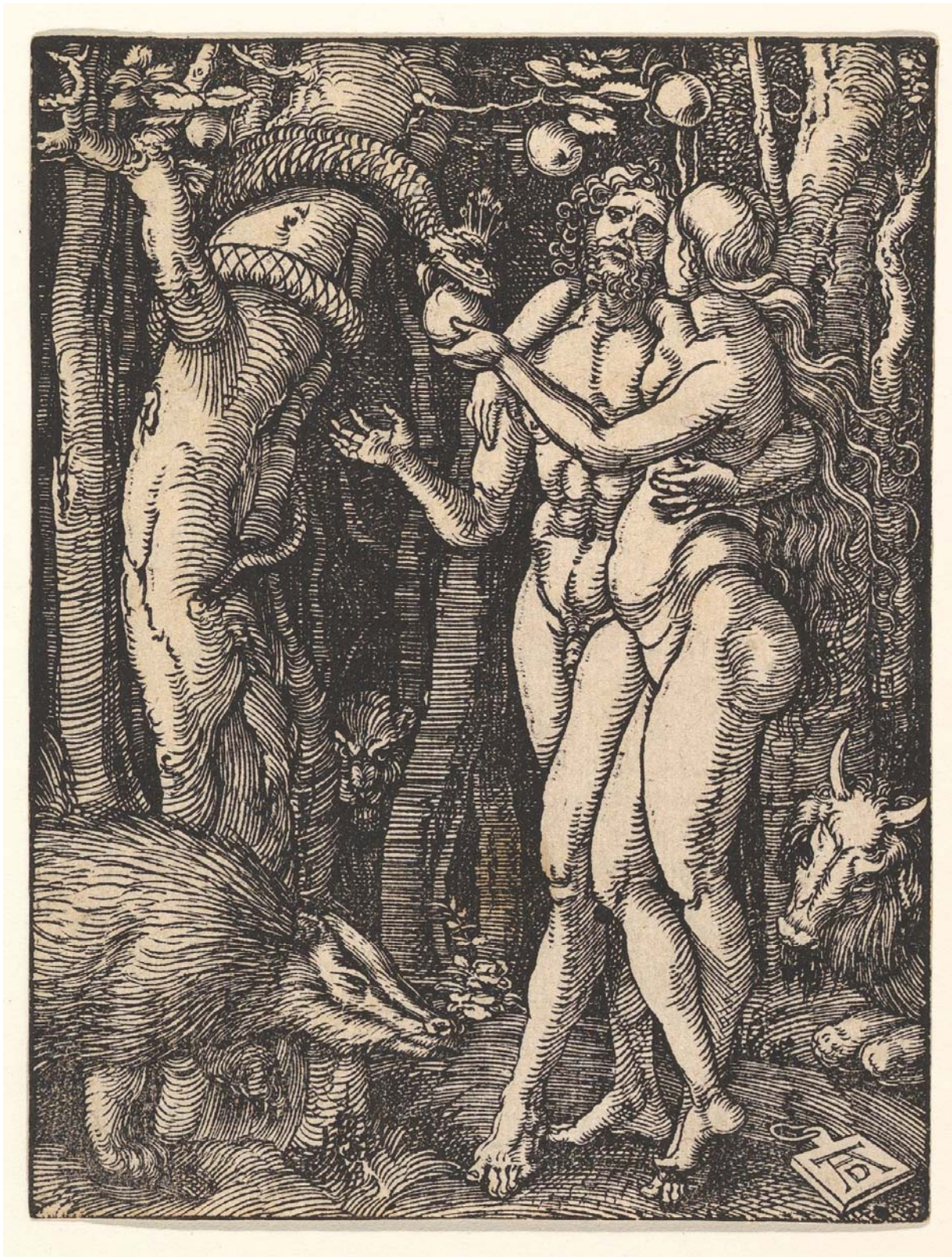
Abb. 3: Albrecht Dürer, Sündenfall (aus der Kleinen Passion), Holzschnitt, ca. 1510, New York, Metropolitan Museum

Er späht gerade im Moment des sich vollziehenden Sündenfalls aus dem Dunkel der Bäume hervor. Blickt er auf das Paar, das in intimer Umarmung den