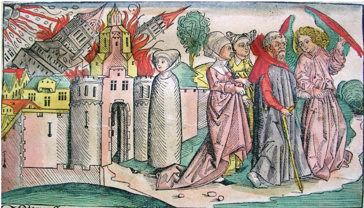
Abb. 6: Michael Wolgemut und Werkstatt, Lot und seine Töchter verlassen das brennende Sodom, Illustration der Schedel'schen Weltchronik, 1493, fol. 21r