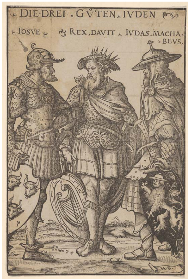
Abb. 1: Hans Burgkmair, Drei gute Juden, Holzschnitt, um 1516, New York, Metropolitan Museum

Bildern – ‘übernehmen’ und selbst kontextabhängig überlegen, wie weit die Kreise beim Verstehen des Gemeinten zu ziehen sind, welche Merkmale letztlich von wo nach wohin zu übertragen sind. 2. Es muss bei Metaphern nicht selten zwischen der artikulierten Oberfläche und einer dahinter stehenden konzeptuellen Kopplung von A und B unterschieden werden. Eine wichtige Einsicht des Metapherverständnisses der kognitiven Linguistik ist es, dass diverse mögliche sprachliche Ausformungen als Varianten einer dahinter stehenden konzeptuellen Metapher betrachtet werden können. Angenehmerweise fallen nun bei der sprachlichen Formulierung „Achill ist ein Löwe“ die sprachliche Oberfläche und die aufgerufene konzeptuelle Verbindung eines Ursprungs- und eines Zielbereichs quasi zusammen. Ähnliches gilt für das Wappen, das Hans Burgkmair dem alttestamentarischen Helden Judas Makkabäus zugeordnet hat (Abb. 1).