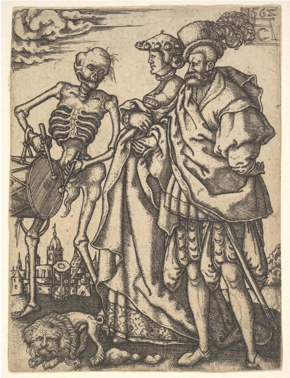
Abb. 4: Monogrammist AC, Totentanz, Kupferstich, 1562, New York, Metropolitan Museum

Das letzte Beispiel (Abb. 4) entstammt nicht der religiösen Sphäre, sondern dem typisch frühneuzeitlichen Feld moralischer Kritik und Erbauung.