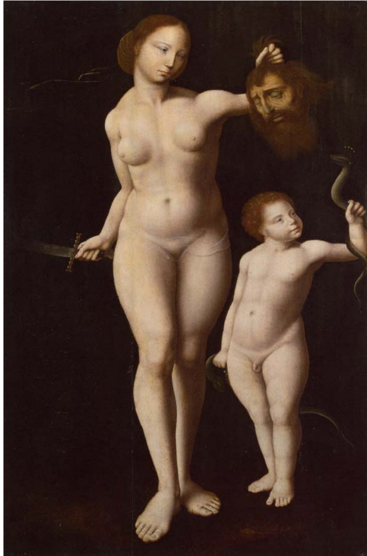
Abb. 5: Meister der Mansi-Magdalena, Judith und Herkules als Kind, Öl auf Holz, ca. 1530, London, National Gallery, © The National Gallery, London. Bequeathed by Charles Haslewood Shannon, 1937

Auf einer ersten Ebene muss dies so verstanden werden, dass es die Herkunft des vom Herkulesknaben abgewehrten Tiers von Juno signifiziert, die ihn im Kindbett töten lassen wollte (Jones 2011: 130). Junos Attribut ist der Pfau. Der Hybridisierung liegt nun also kontextbedingt eine kontiguitäre, metonymische Beziehung zugrunde. Raffinierterweise eröffnet sich so aber auch leichter die Hintertür, das Geschehen um Herkules, den seit dem Frühmittelalter schon christianisierten Tugendhelden (vgl. Schmitt 1975: 66–83), allegorisch mit der zweiten Person des Bildes zusammenzudenken, einer Judith (der exemplarisch Demütigen), die das abgeschlagene Haupt des Holofernes (Personifikation insbesondere des Hochmuts und der Wollust) präsentiert (vgl. Taylor 1984: bes.