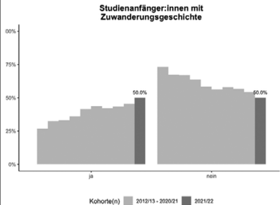
(2) Studienanfänger:innen mit Zuwanderungsgeschichte.