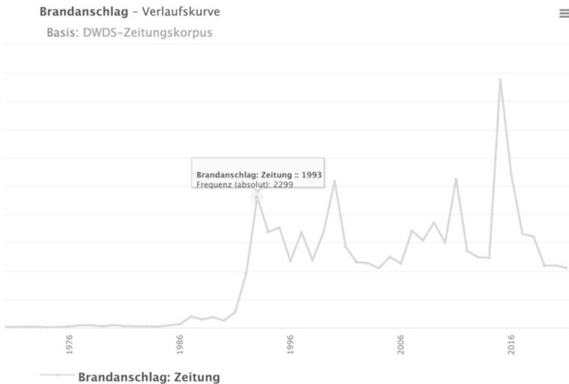
Abb. 6: DWDS – Verlaufskurve von Brandanschlag (Zeitraum 1946 bis 2021)

Über den Wortverlauf lassen sich zugleich gesellschaftliche Entwicklungen im Zeitverlauf erschließen, die das Thema Brandanschlag in der Öffentlichkeit aufgreifen bzw. darüber berichten. Insgesamt lässt sich festhalten, dass das Wort Brandanschlag unter Rückgriff auf die hier vorliegende Textsammlung allgemeingültige Rückschlüsse auf die deutsche Sprache ermöglicht 7 und mit Solingen oder Mölln sowie politisch motivierten Gründen kontextualisiert wird (hier insbesondere rechts- oder linksextrem). Doch wie zeichnet sich der Sprachgebrauch in dem nun heranzuziehenden Spezialkorpus bzw. ›Solingen‹-Korpus aus und wie werden die Betroffenen dargestellt? Schauen wir uns dazu nun zunächst die Kontexte des Wortes Brandanschlag genauer an, um dann Kontexte des Familiennamens Genç zu untersuchen.