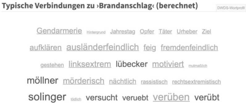
Abb. 5: DWDS – Suchabfrage >Brandanschlag<, typische Wortverbindungen

Gedächtnis, das ich an dieser Stelle als Mentalitäten 4 einer Zeit im Sinne Hermanns (1995) deute: