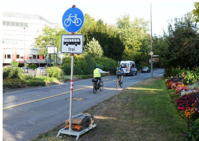
Abbildung 2: Fahrbahnmarkierungen und Beschilderung der temporären Umweltspur in der Trierer Christophstraße.

Lernen auch 50 Jahre nach der Bundesassistentenkonferenz nicht flächendeckend an deutschen Universitäten durchgesetzt. In dementsprechend immer wieder aufkommenden Diskussionen finden allerdings die Stimmen der direkt betroffenen Studierenden nur selten Gehör. Zwar liegen Studien vor, die Forschendes Lernen in der Lehrer*innenausbildung an deutschen Universitäten aus der Perspektive der Studierenden analysieren (z. B. Schneider & Wildt, 2003), allerdings wird in vielen Ratgebern zur breitangelegten Etablierung des Forschenden Lernens in Studiengängen abseits der Lehrer*innenausbildung (z. B. Hochschuldidaktisches Zentrum der Technischen Universität Dortmund, 2009; Sonntag et al., 2017) in der Regel über die Studierenden gesprochen, anstatt sie selbst zu Wort kommen zu lassen. Diese Lücke wird im Folgenden geschlossen, indem Studierende eine Zwischenbilanz des Umweltspurprojekts an der Universität Trier ziehen, in dem die Idee des Forschenden Lernens in die Praxis umgesetzt wurde.