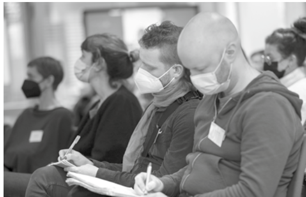
Blick ins Plenum.

unsichtbar gemacht. Auch die Digitalisierung verschleierte die Lebens- und Arbeitsbedingungen prekär Beschäftigter zusätzlich. Die Frage aus dem Publikum „Wer sorgt für die Prekären?“ (Annette von Alemann, Universität Duisburg-Essen) verdeutlicht die Zustimmung der Ergebnisse der Studie von Wimbauer und Motakef.