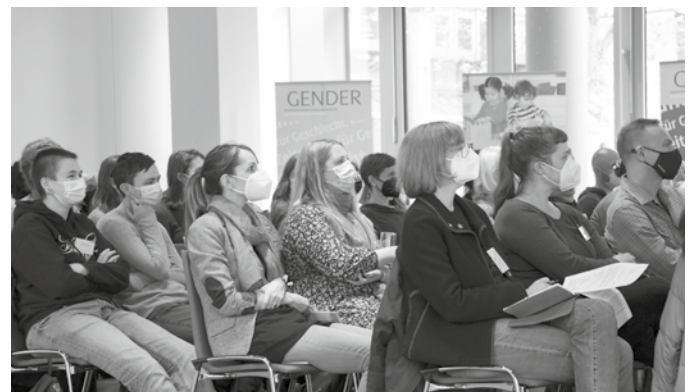
Blick ins Plenum.

als „zugespitzte Ausnahmesituation“, dass die „Care-Krise“ und die ungerechte Verteilung unbezahlter Arbeit gar keine Krise in dem Sinne sei, sondern ein Dauerzustand. Unterschiedliche Begriffseinheiten fordern einen intersektionalen Standpunkt, in dem gefragt wird, für „wen welche Krisen wie relevant, oder besser: wie gefährlich sind“, und demzufolge müssten Krisen und Utopien aus unterschiedlichen Perspektiven herrschaftskritisch betrachtet werden. Und zudem müssten wir uns in feministischer Absicht fragen, wie „Fantasie und Utopie, Sorge und Welt und nicht zuletzt Krisen und Interventionen unser Leben bestimmen“.