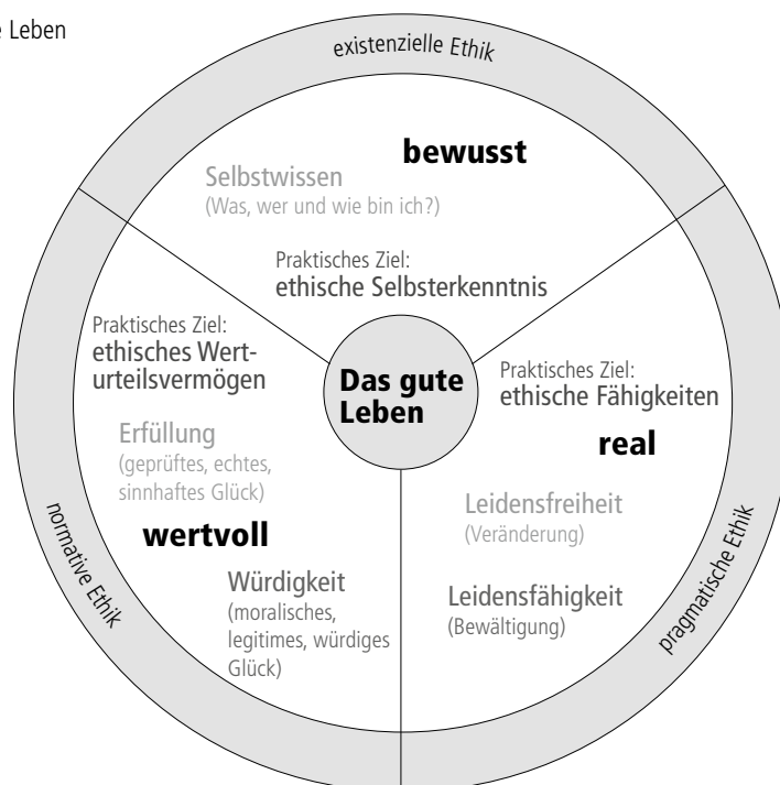
Abbildung 2: Das gute Leben

Bei der Debatte des Guten Lebens wird oftmals der Wille zum guten Leben zentral gesetzt. Einfach ausgedrückt in einem Zitat, das ohne genaue Quellenangabe immer wieder Immanuel Kant zugeschrieben wird und ihn sagen lässt: „Ich kann, weil ich will, was ich muss“. Dazu schreibt Hendrik Wahler in seiner Dissertation (2018): „Der universale Wille zum guten Leben strebt also nach dem guten Glück, welches nicht unser hedonistisches, sondern unser ganzes Wesen in Anspruch nimmt (Schopenhauer). Dieses Glück ist ein besonderes, philosophisch ausgezeichnetes Glück – ein (existenziell) bewusstes, (normativ) wertvolles und (pragmatisch) reales Glück – und bildet den Bezugspunkt des guten Lebens, indem es in sich nicht nur die natürlichen (egoistischen) Neigungen und (pragmatischen) Bestrebungen des Menschen vereint, sondern auch dessen Streben nach (existenziellem) Wissen sowie sein Interesse an (normativen) Werten“ (Wahler 2018: 58). Wahler hat diesen hochkomplexen Zusammenhang in folgendem Schaubild gefasst: