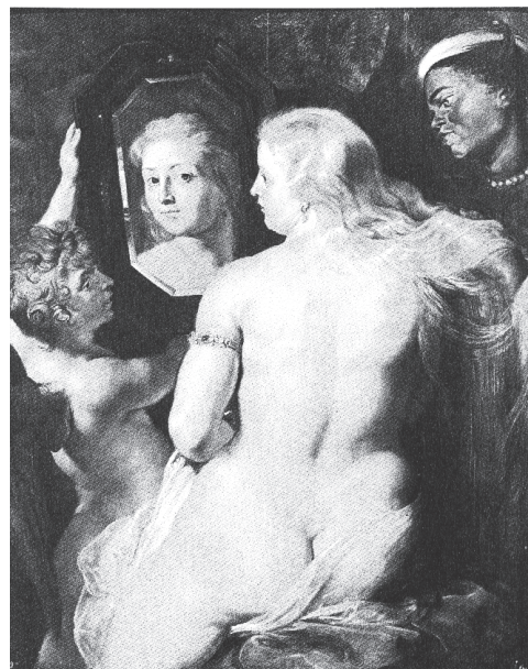
Für Rubens: Ein Frauenrücken – für Simone de Beauvoir: eine „Gegebenheit ohne Bestimmung“

Der zweite Teil der Anthologie besteht aus den eigentlichen Rezensionen: Es handelt sich um 35 kürzere oder längere Texte aus der Tages- und Wochenpresse, aus Illustrierten und Kulturzeitschriften.