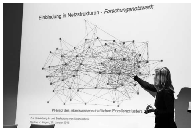
Nadine V. Kegen.

Report“, der von der Forschungsstelle des Netzwerks Frauen- und Geschlechterforschung NRW laufend erstellt wird, könne die Diskussion um Geschlechtergerechtigkeit in die Hochschulen getragen werden.