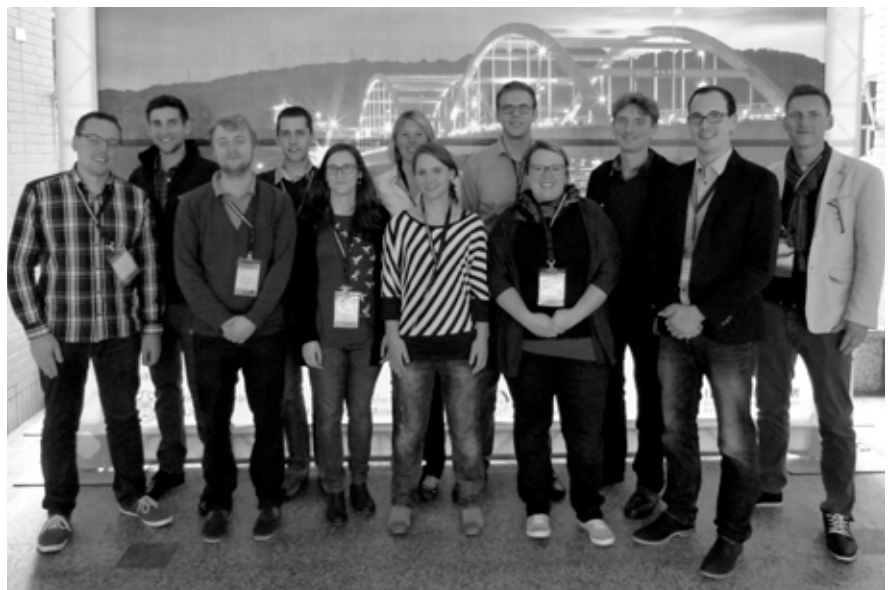
(4) FUTURE WATER-Kollegiat*innen bei der YWP Conference 14 in Taipeh, Taiwan.