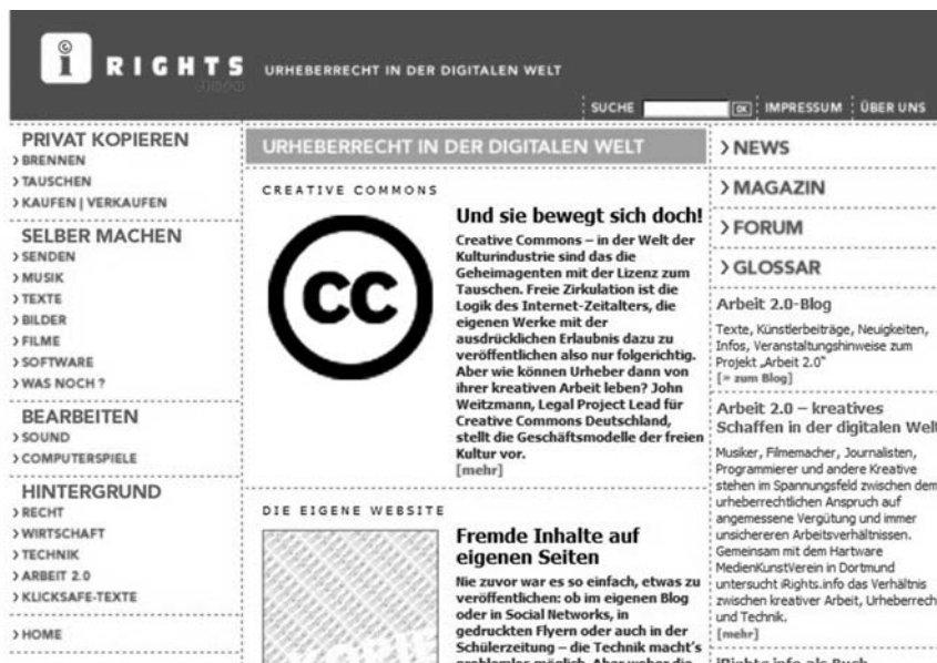
Abb. 2: Das iRights.info – Urheberrecht in der digitalen Welt

somalischen Küste« (Rudolph Walther in der taz vom 20.3.2009). 5 Allerdings sind die von Gaschke als »Netzwerkverstärker« Bezeichneten mit diesem Bedrohungsszenario nicht einverstanden, sie sehen natürlich im Internet und in der digitalen Kopie keine Gefahr, sondern vielmehr eine große Chance für die Wissensgesellschaft und schießen ebenso kompromisslos zurück.