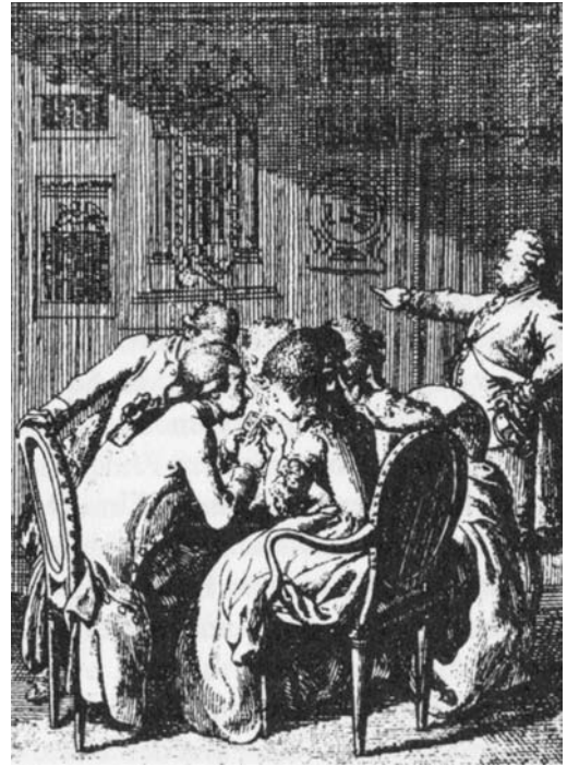
Abb. 3: ›Lesewut‹ im Jahre 1783 – Vorläufer der ›Onlinesucht‹ des Jahres 2009? 22

Der Übergang von der ›Gutenberg-Galaxis‹ zum ›digitalen Zeitalter‹ ist eine weitere Zäsur in einer ganzen Reihe von Medienumbrüchen, die gezeigt haben, dass neue Medien die alten nicht komplett ablösen, sondern deren Bedeutung relativieren und modifizieren – und selbst einen großen Teil ihrer eigenen Form und ihres Wissens aus den alten Medien akkumulieren. Die Schrift im Buchformat kann für die Zeit von 1500 bis 1900 als gesellschaftliches Leitmedium beschrieben werden, um 1900 setzten sich dann mit Fotografie und Film die visuellen Medien durch, um 2000 die digitalen (Computer-)Medien, die die Schrift- und Buchkultur nun noch mehr minorisieren. 19 Doch mit welchen Debatten war die Durchsetzung des Buchdrucks verbunden, und inwiefern finden sich darin ähnliche Auseinandersetzungen um die Qualität der Künste, die Emanzipation der Bildung sowie