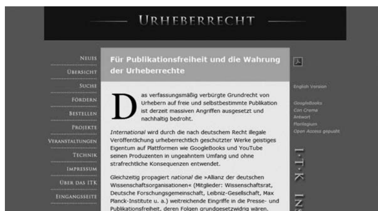
Abb. 1: Der Heidelberger Appell als Open-Access-Version.

Dieses diskursive Ereignis war der Auftakt für eine breite Feuilletondebatte, in deren Folge es weitere Polemiken gegen die »digitale Enteignung der Urheber« (Susanne Gaschke in der Zeit vom 4.4.2009) 4 gab und sogar noch tiefer in die metaphorische Mottenkiste gegriffen wurde: »Die Google-Piraterie und der ›Open-access‹-Schwindel sind gefährlicher als die Piraterie entlang der