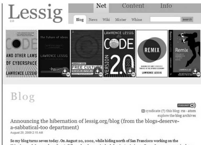
Abb. 5: Lawrence Lessigs Weblog