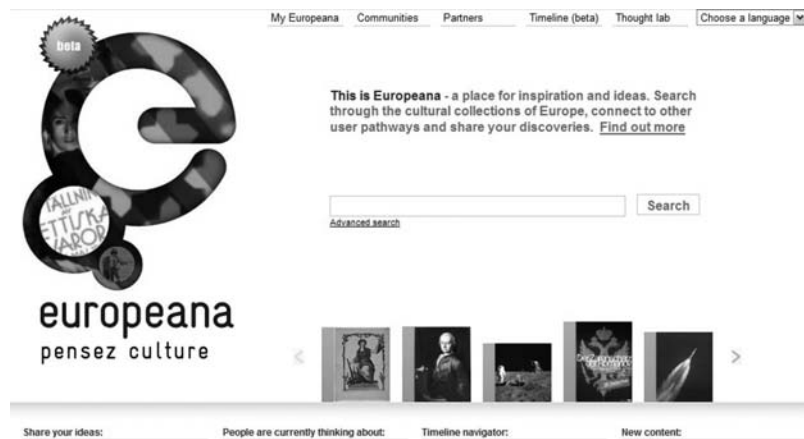
Abb. 4: Europeana (2009)

sierten Allgemeinheit beispielsweise rechtfreie oder vergriffene und nicht neu aufgelegte Texte öffentlich zugänglich zu machen, nicht schon längst von staatlicher Seite aus in Angriff genommen wurde. Zwar gibt es inzwischen mit der Plattform Europeana (seit 2008) 33 ein solches europäisches Projekt, dieses ist jedoch noch im Aufbau begriffen. Allerdings wird der Wille des öffentlichen Sektors immer größer, Fördergelder für Open-Access-Textdatenbanken zur Verfügung zu stellen – und auf diese Weise Wissensbestände kostenlos und wesentlich einfacher zur Verfügung zu stellen.