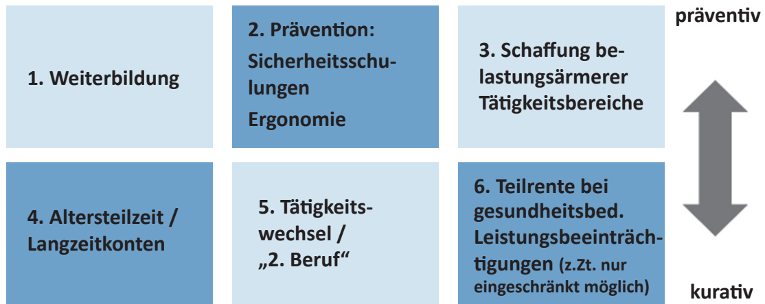
Abbildung 1: Bausteine einer altersgerechten Arbeits- und Laufbahngestaltung

Ein zentraler Baustein ist dabei die Prävention gesundheitlicher Risiken. Durch die Bereitstellung von ergonomischen Hilfsmitteln wie Hebebühnen oder den Einsatz neuer, entlastender Techniken und Baustoffe sowie entsprechender Sicherheitsschulungen werden Voraussetzungen dafür geschaffen, die Gesundheit der Beschäftigten mit fortschreitendem Alter soweit zu erhalten, dass gegebenenfalls ein Wechsel in neue Tätigkeiten erfolgreich vollzogen werden kann.