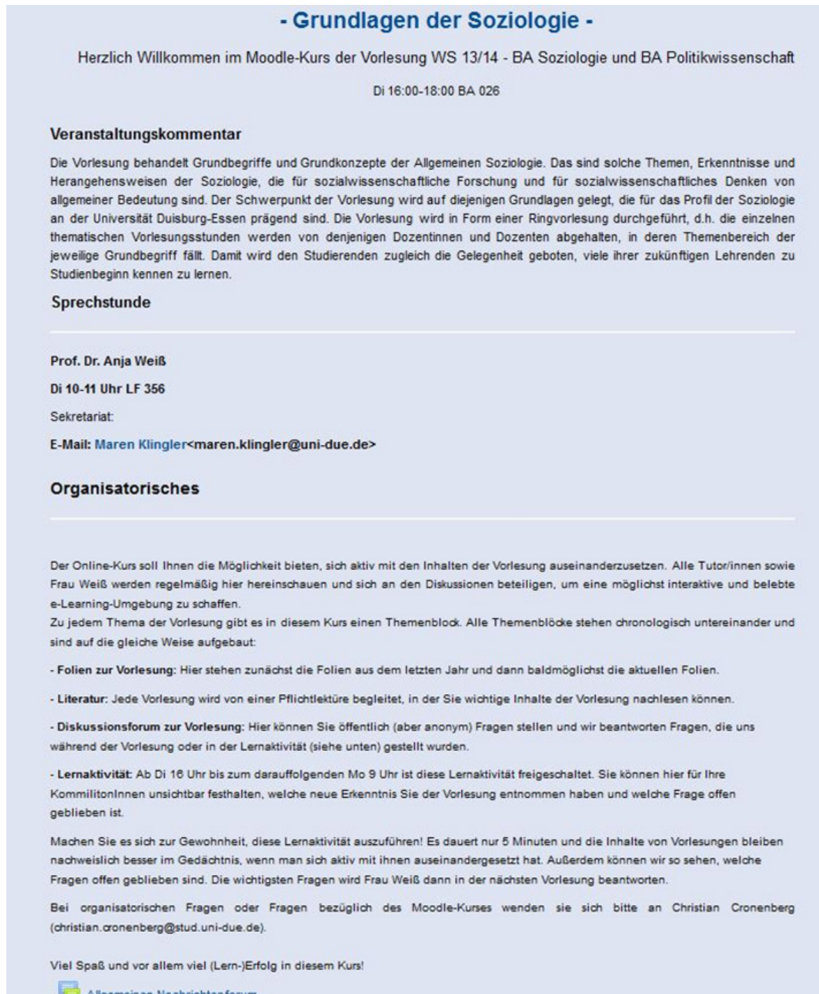
Abb. 1: Einführung/Organisatorisches

Bei der Erstellung des virtuellen Kursraums wurde das Themenformat gewählt, jedoch wurden nicht die einzelnen Themen genannt, sondern die jeweiligen Vorlesungstermine hinterlegt. In jedem Abschnitt sind neben einem anonymen Forum vor allem Lektürehinweise, die Audiodateien der jeweiligen Sitzung und Vorlesungsfolien zu finden. Des Weiteren wird die Lernaktivität Aufgabe in jedem Abschnitt zur Abbildung der One-Minute-Paper-Methode herangezogen. Sowohl die Frage „Welche Erkenntnis nehme ich mit?“ als auch die Frage „Welche Frage ist offen geblieben?“ soll von Studierenden nach jeder Veranstaltung verschriftlicht und über die Aufgabe hochgeladen werden.