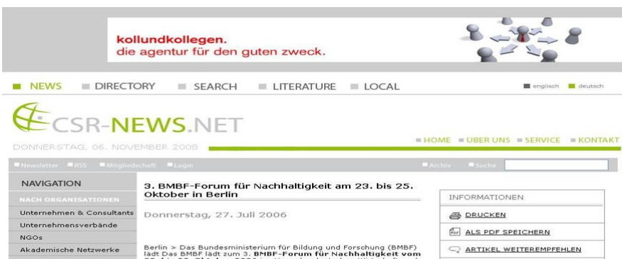
Abb. 4: Webpage CSR-News mit Werbebanner KollundKollegen

Anders als in den Beispielen für Moral als Business Case stellen wir im Folgenden Beispiele dar, in denen die Moral nicht nur der Marktdifferenzierung dient, sondern selbst zu einem Geschäftsfeld geworden ist.