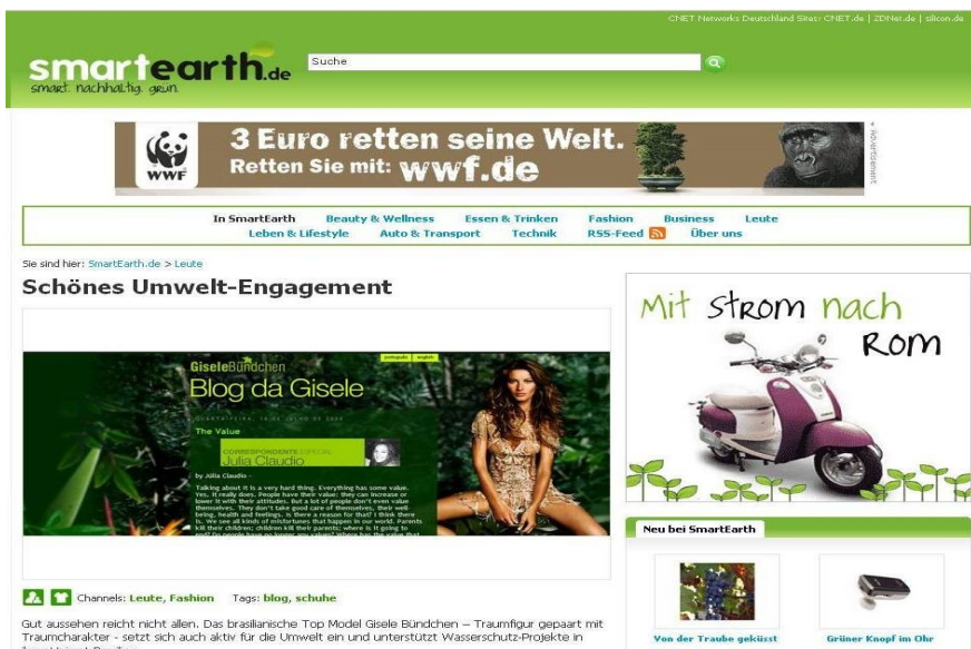
Abb. 1: Website: Smart Earth

Moral besondere Markt Vorteile zu verschaffen. Moral fungiert hierbei als Business Case, da die Demonstration sozialer und ökologischer Verantwortung sich nicht auf den eigenen Geschäftsbereich bezieht, sondern ein Mittel zur Erzielung von Profiten ist.