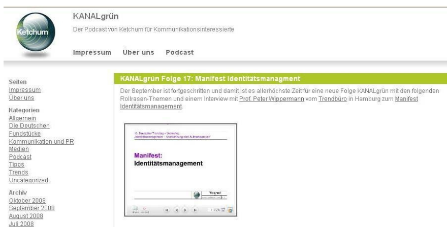
Abb. 5. Webpage: KanalGrün

In dem Internetportal CSR-news.net werden Informationen rund um das Thema der sozialen Verantwortung von Unternehmen behandelt. Zugleich fungiert das Portal als Anlaufstelle für Akteure im Umfeld des Themas. Eine Möglichkeit ist es ferner, auf der Seite Werbebanner zu schalten, die thematisch affin zum Profil der Seite sind, also Werbebotschaften rund um das Thema Corporate Social Responsibility beinhalten. Die in der Abbildung gezeigte Werbung ist der Hinweis auf eine Kreativ und Full-Service Agentur namens KollundKollegen, die sich mit dem Slogan „die agentur für den guten Zweck“ auf Dienstleistungen im Bereich der sozialen Verantwortung spezialisiert hat. In diesem Beispiel verbindet sich inhaltliches Engagement eines CSR-Portals mit der Geschäftsbeschaffung eines privatwirtschaftlichen Unternehmens, wobei der Fokus auf Kommunikation und Design im Feld der CSR-Unternehmenskommunikation liegt.