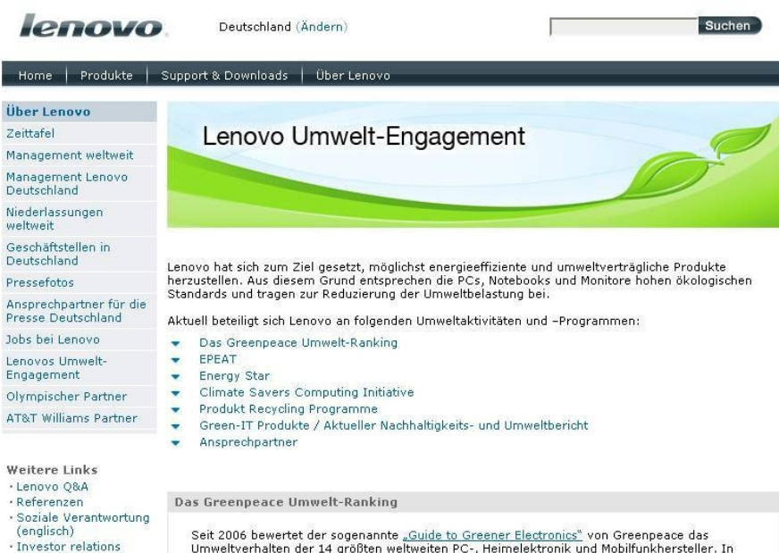
Abb. 2: Webpage: Lenovo Umwelt Engagement

Das amerikanische Medienunternehmen CBS besitzt die Medienplattform CNET, die Anzeigen und Downloads verkauft und zudem als Preisvergleichmaschine fungiert. Auf CNET findet sich der Blog Smart Earth, der eine interessierte Öffentlichkeit »rund um grüne Themen und Produkte« informiert. In diesem Fall wird die Plattform für eine deutschsprachige Zielgruppe unterhalten und hat sich der Vermarktung von Produkten und Dienstleistungen verschrieben, deren Differenzierungsmerkmal grüne Eigenschaften wie Umwelt- oder Sozialverantwortung sind. Redaktionelle Inhalte von CNET sind zum Teil kostenpflichtig, die wiederum weiter gehandelt werden können. In der Abbildung sehen wir eine Werbung für einen weiteren Blog, den das Fotomodell und Schauspielerin Gisele Bündchen unterhält und in dem sich diese für Umweltschutz und Wasserschutzprojekte in ihrer Heimat Brasilien einsetzt. Der Content Gisele Bündchen engagiert sich für die Umwelt dient also für das Medienunternehmen als Plattform, themenaffine Inhalte zu vermarkten, die im abgebildeten Beispiel Anzeigen für den WWF sind. Der Content selber ist eine Reflektion von Gisele Bündchen über Werte und wie diffizil das Thema Werte ist. Der Blog ist allerdings nicht von Gisele Bündchen selber autorisiert, sondern von einer Bloggerin namens Julia Claudio. Insgesamt kann das Beispiel angeführt werden für eine Contentverwertung zur Platzierung von Werbung und Marketing, die über den Content-Wert des moralischen Konsums funktioniert.