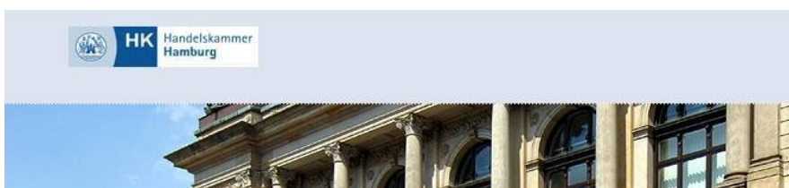
Abb. 6: Webpage Handelskammer Hamburg

Kommunikationsbranche auf der Seele brennen«. 3 Zu diesen Themen zählen ausdrücklich nicht Themen, die man dem ethisch-affinen Bereich zurechnen könnte. Der KanalGrün macht stattdessen die Farbe Grün selbst zu einem Geschäftsfeld, welche üblicherweise Ausdruck eines ökologischen Bewusstseins ist. Das abgebildete Manifest zum Identitätsmanagement greift auf einen ethisch konnotierten Themenkreis zurück und verwendet Moral als kommerzielles Instrument zum Selbstmarketing.